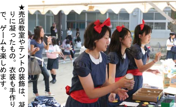
★売店教室やテントの装飾は、凝りに凝ったもの。衣装も手作りで、ゲームも楽しめられます。

今年も多くのクラスがエントリーした舞台発表。身体、表情、衣装、音楽、照明などのすべてを表現に活かす舞台発表は、何度も回数を重ねて練習に励みます。初めは、身体も表情も固く、ダンスの振付もなかなか決まらな... クラスの結束や知恵が求められます。そこで、リーダーが中心になり、練習スケジュールをつくり、クラスを引っばっていきます。いよいよ、本番という頃には、リーダーも、クラスも、自分たちのクラス作品に自信を持ちます。