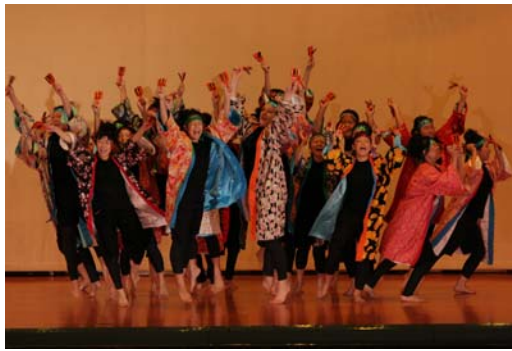
★舞台発表は、高い表現力が求められます。衣装や演出など、力が入ります。

7月からスタートしていたクラスの取組みは、共同制作、コーラス、民舞、創作ダンス、ステーションヤレンジ、売店、模擬店などの部門へのエントリーからです。1ヶ月近い長期に渡る取組みだからこそ、その中身はすべて生徒の自主性や企画、行動力に任せられます。